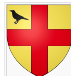
Wapenschild van Arnold van Craaynem. [3] Hij vocht in de Grimbergse oorlog tegen de Berthouts, heren van Grimbergen.

Uiteindelijk werden de Berthouts in 1359 verslagen door het gezamenlijke leger van de Vlamingen en de Brabanders. Het machtige kasteel van Grimbergen werd verwoest en ging volledig in vlammen op. Waarschijnlijk is het kasteel van Bouchout aan het einde van de Grimbergse oorlog gebouwd. Volgens Cantillon[4] was Bouchout toen reeds een versterkt kasteel. Echter, Willem van Craaynem, de zoon van Wouter, bezat slechts weinig grond (300-400 are) zodat het ook heel goed mogelijk is dat het "kasteel" toen slechts een verstevigde woning was, gebouwd rond 1160-1170.